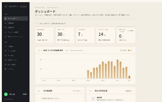
管理ダッシュボード